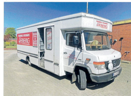
Das Frischemobil ist vielen bekannt...

Der Entschluss zur Schließung zum Jahresende fiel den Inhabern demnach nicht leicht. Es ist jetzt aber an der Zeit, mit Stolz auf das Erreichte zurückzublicken. Es ist ein Erfolg, über einen so langen Zeitraum eine Firma als Familienbetrieb aufrecht zu erhalten.