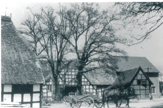
Das Stammhaus Ende der 50er Jahre in Bohnhorst

Somit hat die Familie Heineking mit ihrer Belegschaft als Nahversorger bis zum Schluss wirklich viel geleistet. Gerade die Einwohner der Gemeinde Warmsen und Umgebung haben die Einkaufsmöglichkeit vor Ort häufig genutzt. Es wird eine große Lücke entstehen, die hoffentlich doch noch wieder geschlossen werden kann, auch wenn bei Redaktionschluss noch kein Nachfolgekonzert vorlag.